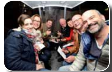
Wein-Gondolieri beim Genuss-Gondeln