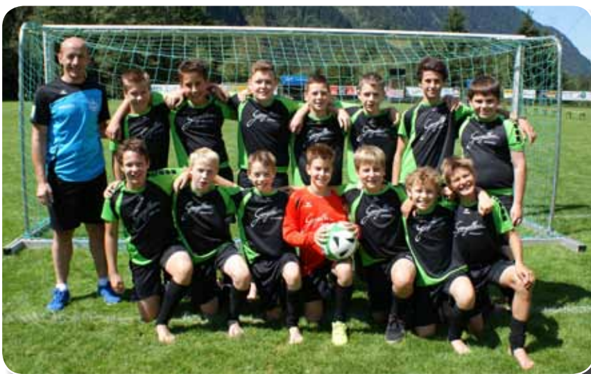
Das U14 Team sind ungeschlagen Meister der Gruppe 4 geworden.