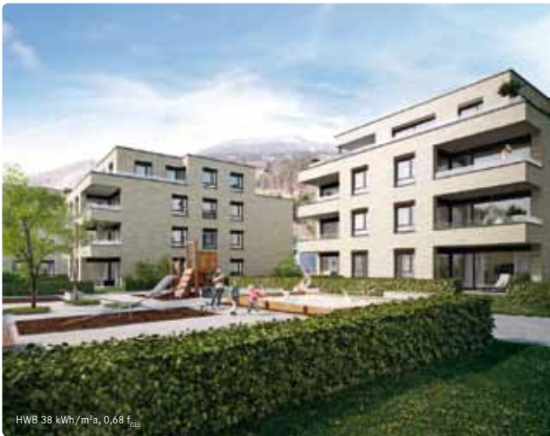
HWB 38 kWh/m 2 a, 0,68 f g,ext