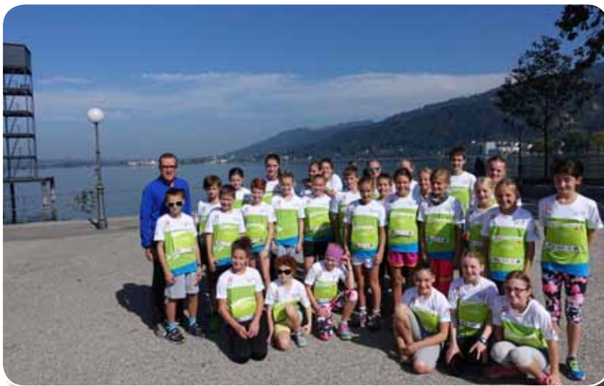
Schüler und Schülerinnen der 1a, 2a und 3a beim Bregenz Marathon