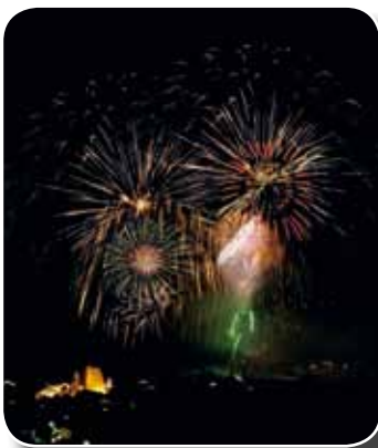
Feuerwerk in St. Gallenkirch