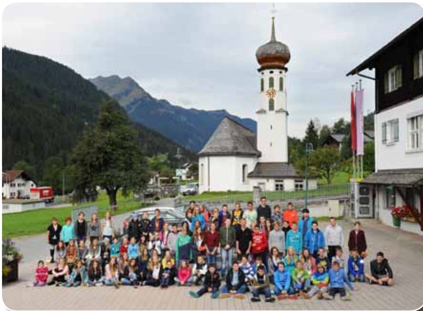
Alle Schüler und Schülerinnen der NMS Innermontafon

Zudem sind mehrere eintägige Schulveranstaltungen vorgesehen.