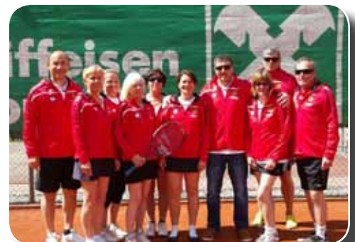
Stolz präsentieren die Clubmitglieder die neuen Dressen.