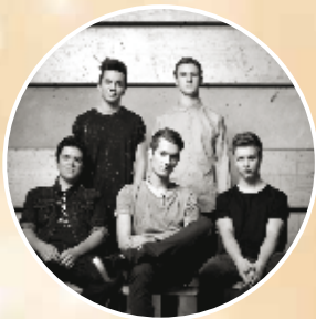
TAGTRÄUMER aus Österreich