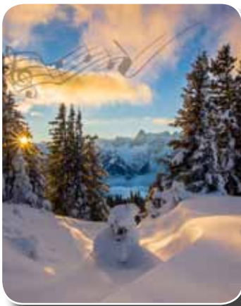
Montafoner Winterzauber

Zusätzlichen Drive gaben die Top-Acts. Waren es am 4. und 5. Dezember das norwegische Pop-Rap- und Reggae-Duo MADCON und das österreichische Produzenten-Duo Klangkarussell, legten das Wochenende darauf der Singer-Songwriter „Daniel Wirtz sowie die Hamburger Rocker Revolverheld los. Danach wurde auf den Partymeilen quer durch das Montafon der Wintersaisonauftakt gebührend gefeiert.