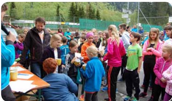
Kinder bei der Siegerehrung