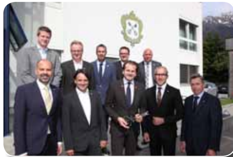
Schlüsselübergabe an den neuen Standesrepräsentant, Bürgermeister Herbert Bitschnau

Im Bereich der Talschaftsverbände soll analysiert werden, welche Aufgaben auch künftig gemeinsam bewerkstelligt werden sollen. Dazu sind dann die erforderlichen Strukturen und Ressourcen zu definieren.