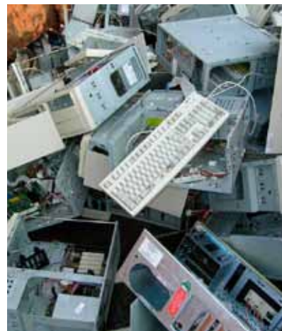
Nähere Informationen und Adressen der Sammelstellen gibt es auf www.elektro-ade.at

Gemeinsam können wir eine lebenswerte Zukunft gestalten. Der Weg zur Sammelstelle ist ein einfacher Schritt in die richtige Richtung!