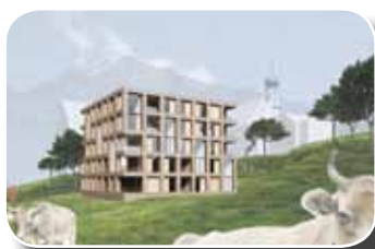
Visualisierte Darstellung - Neue Wohnanlage der Alpenländischen Heimstätte in St. Gallenkirch