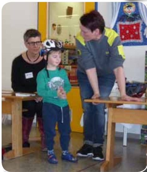
„Helm auf - gut drauf!“