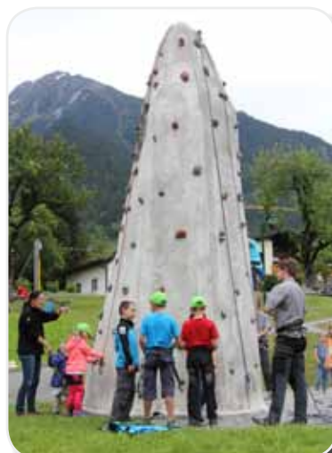
Großer Andrang beim Kletterturm