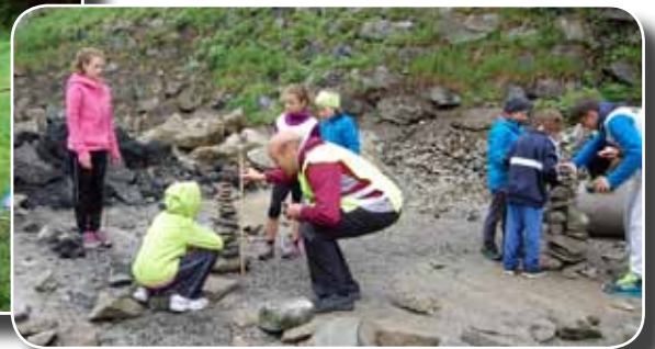
Slackline überqueren, Spinnennetz überwinden und Steinmännchen bauen