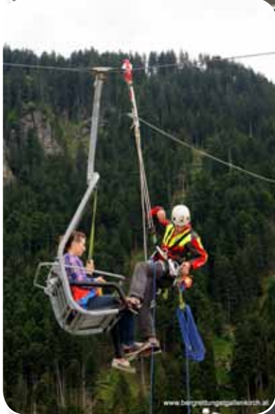
Rettungsvorführung - Abseilen vom Sessellift