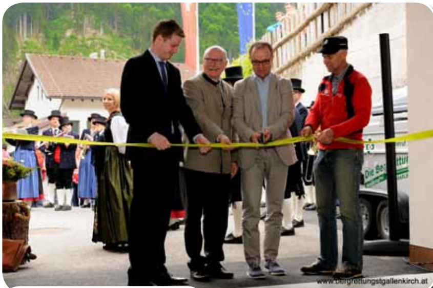
Unsere Ehrengäste eröffnen den Stützpunkt.